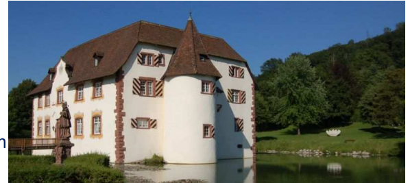
(Wasserschloß in Inzlingen)